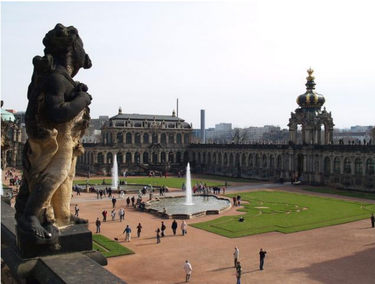
A híres Zwinger